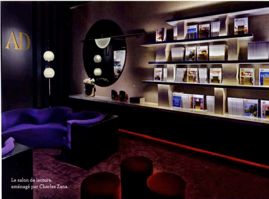
Le salon de lecture, aménagé par Charles Zana.